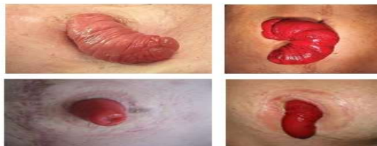
بیرون زدگی استوما